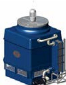
TORRI EVAPORATIVE EWK