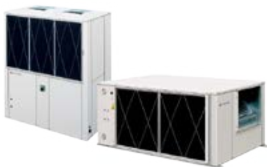
WLHP (ANELLO D'ACQUA)