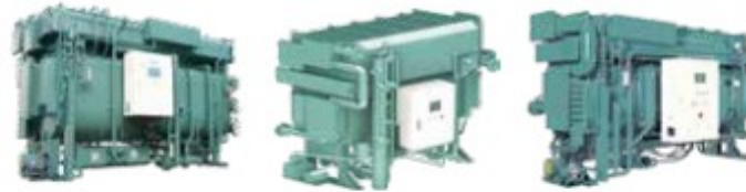
Assorbitore ad Acqua Calda Doppio Effetto Assorbitore ad Acqua Calda Doppio Salto Assorbitore ad Acqua Calda Singolo Effetto