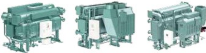
Assorbitore a Vapore Assorbitore a Gas Esausti Assorbitore a Fiamma Diretta