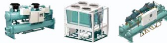
Refrig. Centrifugo Oil-Free Refrigeratore ad Aria Refrigeratore a Vite ad Acqua