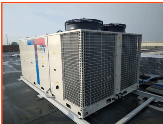
Unità Roof-Top Hitecsa presso Motocard Castelfranco Veneto

Motocard Bike S.L. di Barcellona (Spagna) è un'azienda leader nella distribuzione di attrezzature motociclistiche, con più di 40 anni di esperienza, presente, con numerosi negozi, nella penisola iberica e in Italia. Ultimo nato è il punto vendita di Castelfranco Veneto (Treviso) che, come numerosi altri, è climatizzato con unità Roof-Top prodotte da Hitecsa di cui gruppo ATR ha la rappresentanza esclusiva per l'Italia.