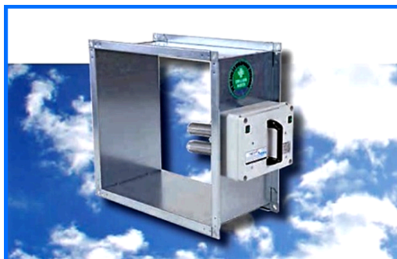
Sistema di sanificazione SanAir

Le piscine coperte sono ambienti dove non è più sufficiente eseguire il solo controllo della temperatura per assicurare il benessere degli occupanti e la buona conservazione delle strutture. L'ingente quantità di vapore acqueo prodotta dagli specchi d'acqua e dalle attività fisiche dei bagnanti è una causa di disturbo che deve essere rimossa immediatamente con interventi mirati, efficaci, ma pur sempre dal basso impatto economico.