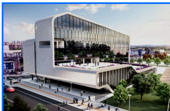
ICS Symbiosis - International School Milano *

La climatizzazione , la deumidificazione e la sanificazione della piscina coperta semi-olimpionica (25 metri) sono curate e soddisfatte da un'unica speciale apparecchiatura autonoma, progettata, prodotta e fornita da gruppo ATR di Castelfranco Veneto Treviso.