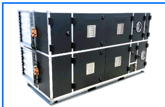
Deumidificatore termodinamico DTP 09 DF 7/5.6